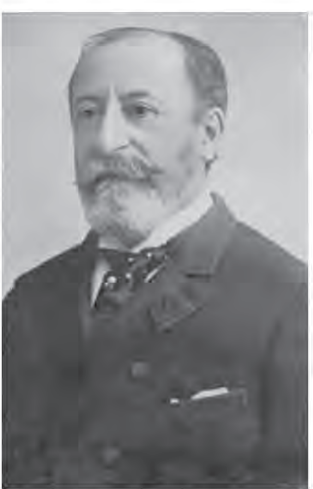
カミーユ・サン＝サーンス

1885年 3度目のローマ大賞の挑戦で「カンタータ「放蕩息子」」で大賞獲得。 1887年 2年間のローマ留学を終え、パリへ戻る。 1889年 国民音楽協会へ入会。パリ万博でガムランなどに接する。