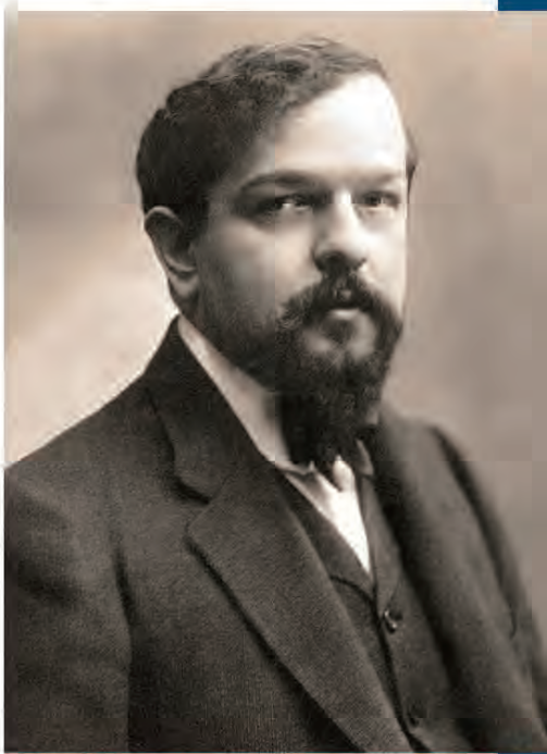
クロード・アシル・ドビュッシー