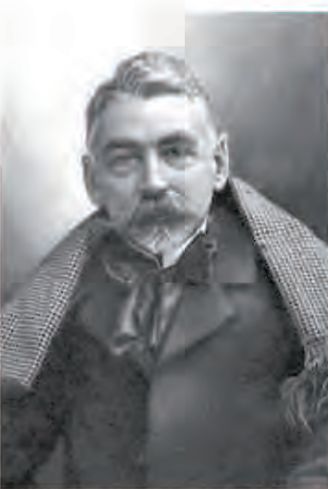
詩人・ステファヌ・マラルメ

1890年 この頃からマラルメの「火曜会」などへ参加。多くの文人や芸術家らと知り合う。彼の作曲語法が形成されていく。