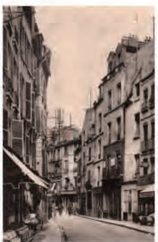
パリ近郊の街 サン＝ジェルマン＝アール

1890年、ドビュッシーは「アシル・クロード」から「クロード・アシル」と名前を変えました。また、この頃から詩人ステファヌ・マラルメの「火曜会」へ参加。また、「カフエ黒猫」など