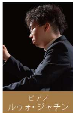
ピアノ ルウオ・ジャチン