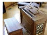
ポジティブオルガン