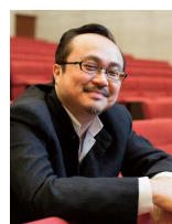
ダン・タイ・ソン