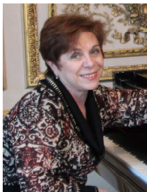
レナ・ シェレシェフスカヤ