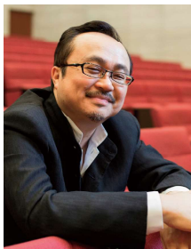
ダン・タイ・ソン