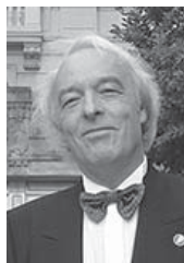
アンドレア・ボナッタ

日程:2016年6月20日(月)、21日(火) 会場:日立システムズホール仙台 シアターホール 集人員:14名(1名1回60分のレッスン) 受講資格:将来音楽家を志す高校生以上25歳以下の方。国籍不問。※2016年4月1日時点