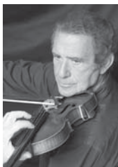
ロドニー・フレンド

日程:2016年5月30日(月)、31日(火) 会場:日立システムズホール仙台 練習室1 募集人員:12名(1名1回60分のレッスン) 受講資格:将来音楽家を志す中学生以上25歳以下の方。国籍不問。※2016年4月1日時点