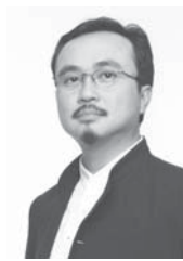
ダン・タイソン