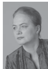
エヴァ・ポプウォツカ